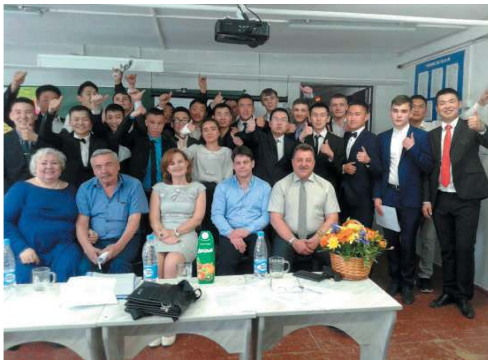
Итоговая государственная аттестация, 2018 г.

по мониторингу ожиданий и удовлетворенности заинтересованных сторон. Мониторинг осуществляется методом анкетирования, собеседования, сбора отзывов, информации в СМИ, участием в независимых рейтингах и обследованиях.