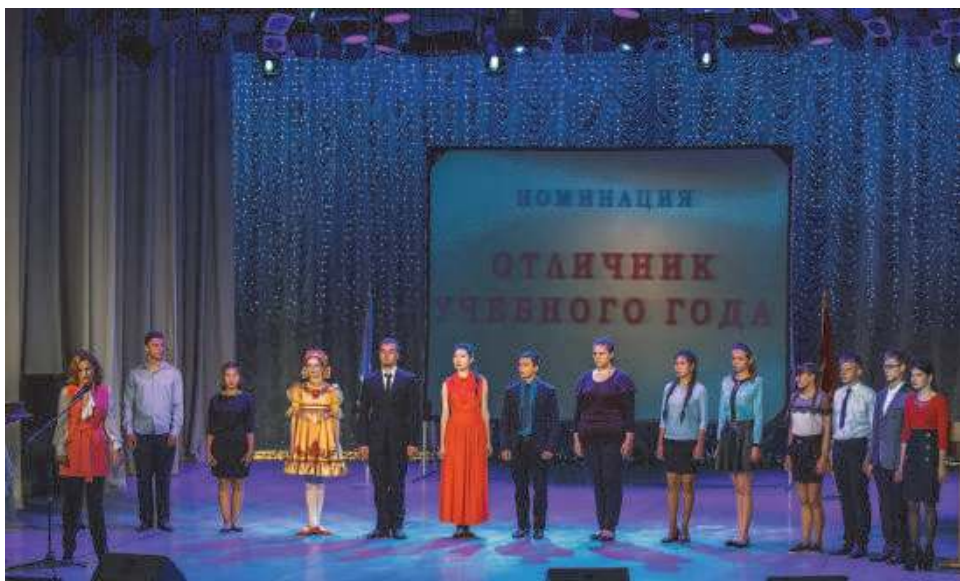
Награждение лучших студентов студентов, 2018 г.

практик, тем выпускных квалификационных работ ведущими специалистами и руководителями подразделений компании, их участие в государственной итоговой аттестации, проведение дней открытых дверей, конкурсов профессионального мастерства и др. Ежегодно на заседании круглого стола с участием всех первых руководителей структурных подразделений АК «АЛРОСА» проходит обсуждение стратегических направлений сотрудничества, потребностей в кадрах и согласование направлений подготовки. Круглый стол является одним из действенных механизмов, регулирующих социальное партнерство.