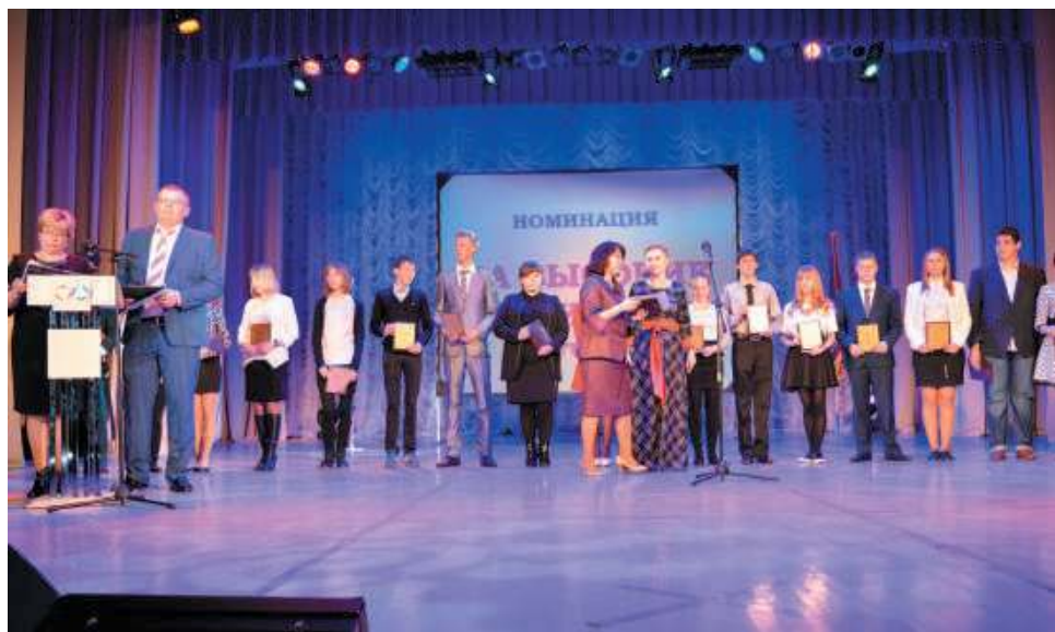
Награждение лучших студентов, 2016 г.

вами, речь идет об изменении подходов к организации учебного процесса, направленных на формирование новых компетенций и, соответственно, достижения нового качества образования. Все это требует значительных изменений, включающих ориентацию образовательных программ профессионального образования на международные стандарты как при подготовке специалистов, проведении итоговой аттестации в форме демонстрационного экзамена, так и при построении системы мониторинга и оценки качества образования.