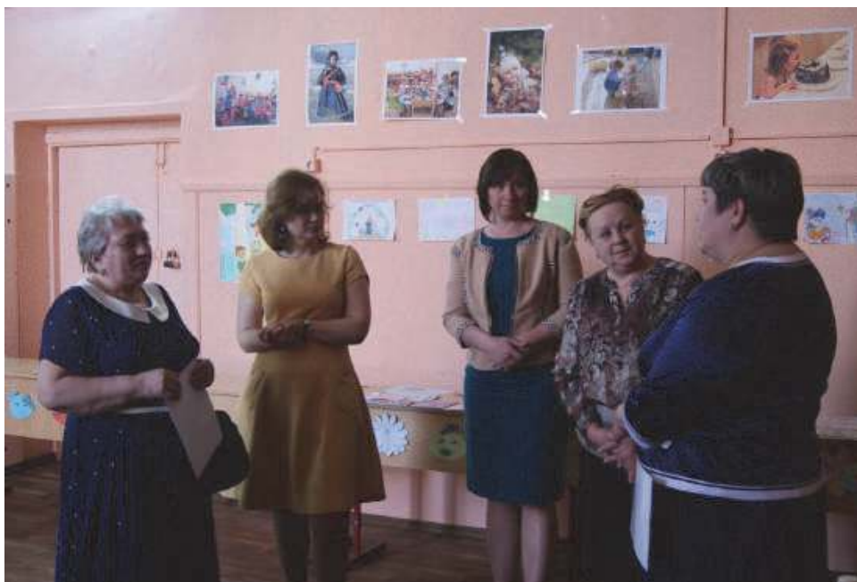
Встреча экспертов Премии Правительства РФ с преподавателями специальности «Дошкольное образование»

разование в колледже своим детям, 83% опрошенных намерены поддерживать связи с преподавателями и мастерами.