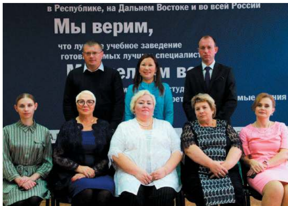
Преподаватели выпускающих кафедр

Выстроенная в колледже система работы с подразделениями АК «АЛРОСА» включает согласование учебных планов, программ производственных