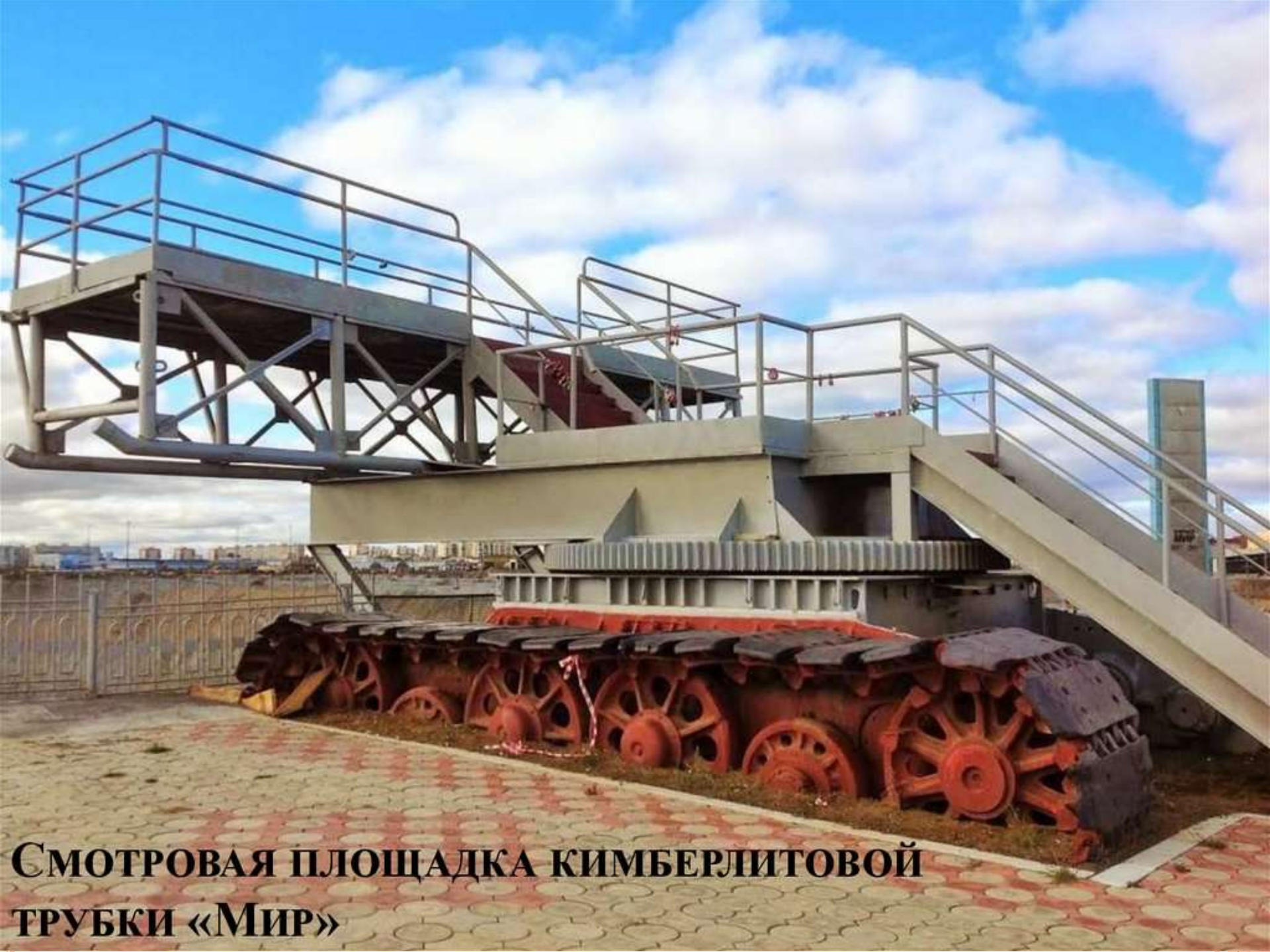
СМОТРОВАЯ ПЛОЩАДКА КИМБЕРЛИТОВОЙ ТРУБКИ «МИР»