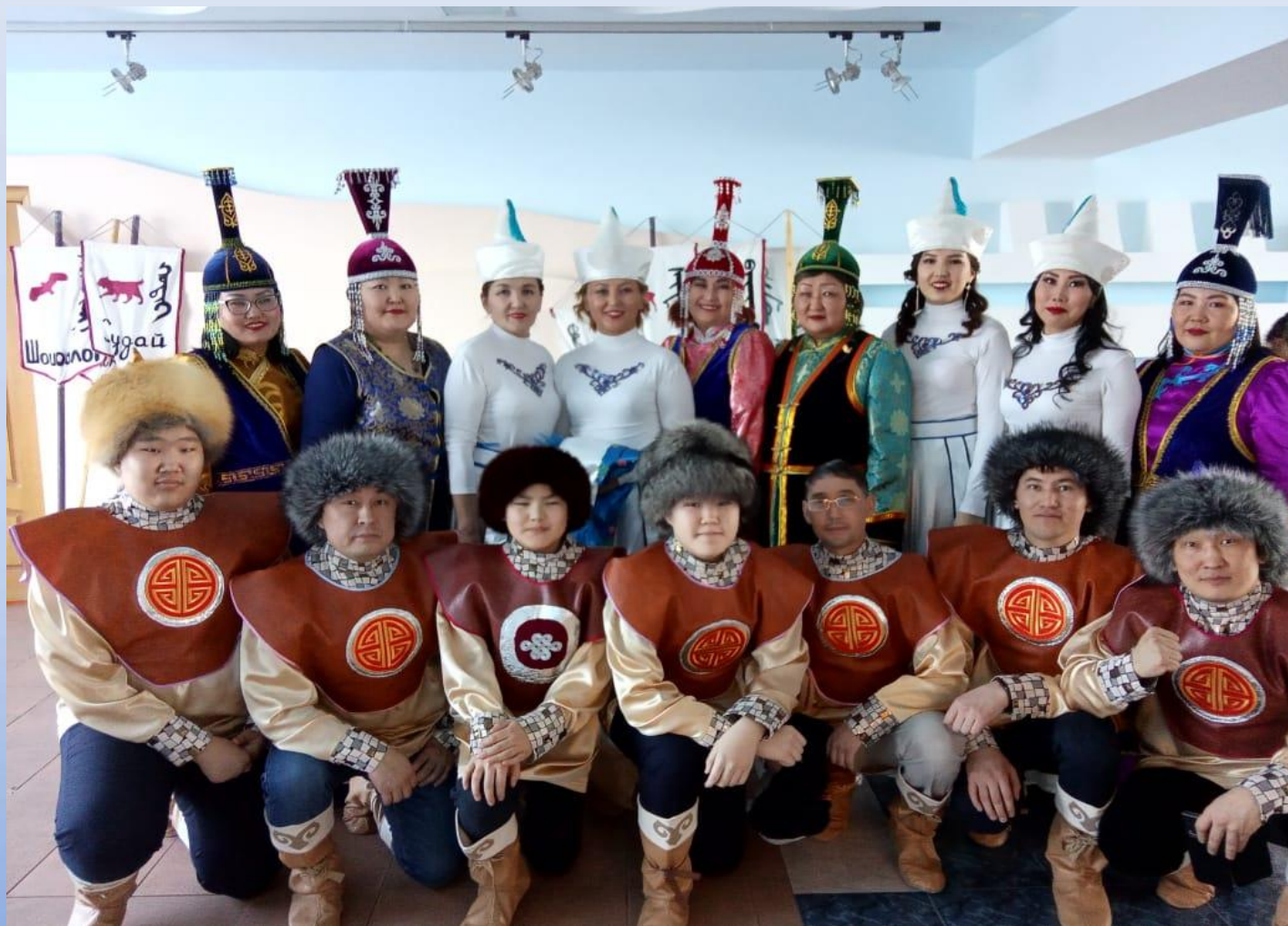
Участие в концерте, посвященному бурятскому празднику «Белый месяц», 2021 г.