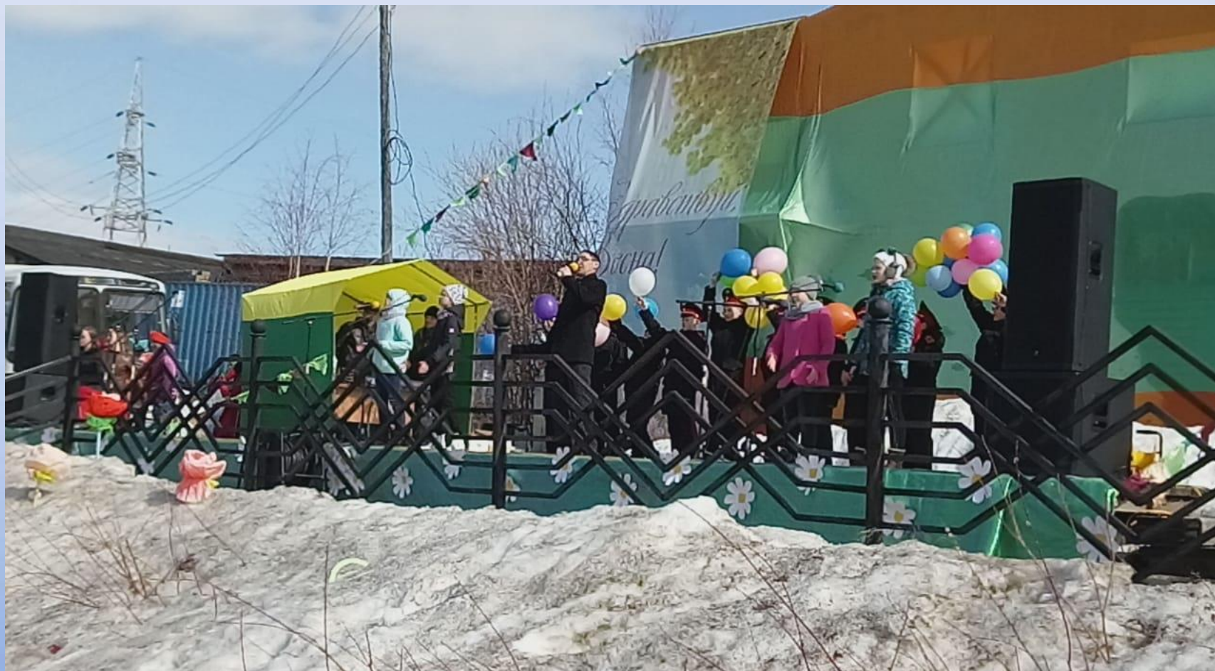
Участие в концерте «Поет мой Чернышевский»