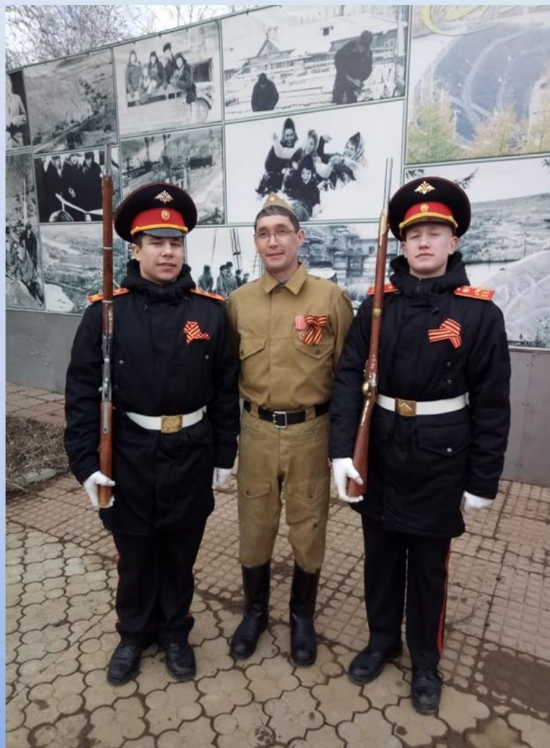
Участие в концерте, посвященному Дню Победы, 2018 г.