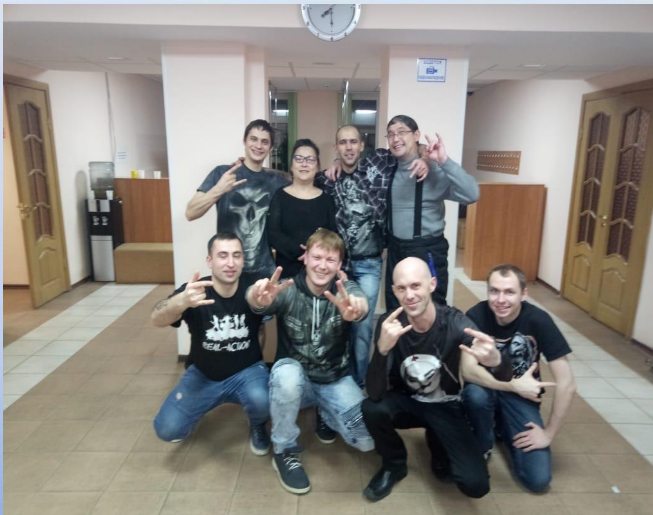
Участие в концерте «Черно-белый блюз» в составе рок-группы «Real Action», 2018 г.